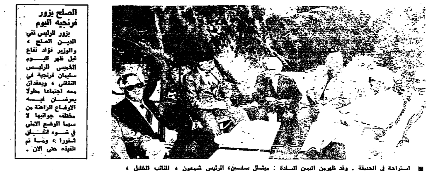
استراحة في الحقيقة . وقد ظهر بين السادة : ميشال ساسين ، الرئيس شمعون ، النائب الخليل ، الرئيس فزجييه والصلح والناقد سليمان العلي .